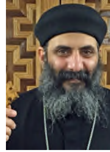
القس شنودة مرقص