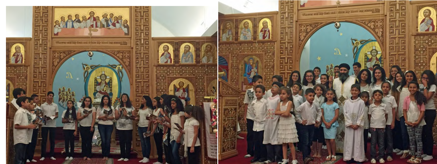
St. Mary's Hymns